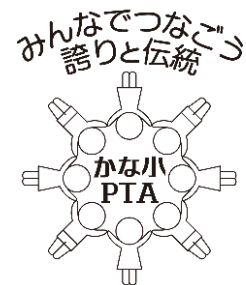
PTAロゴ 令和2年度公募 児童によるデザイン

PTA活動は、会員ひとりひとりの 「子どもたちのために、できる時にできる事を」 の気持ちに支えられています。